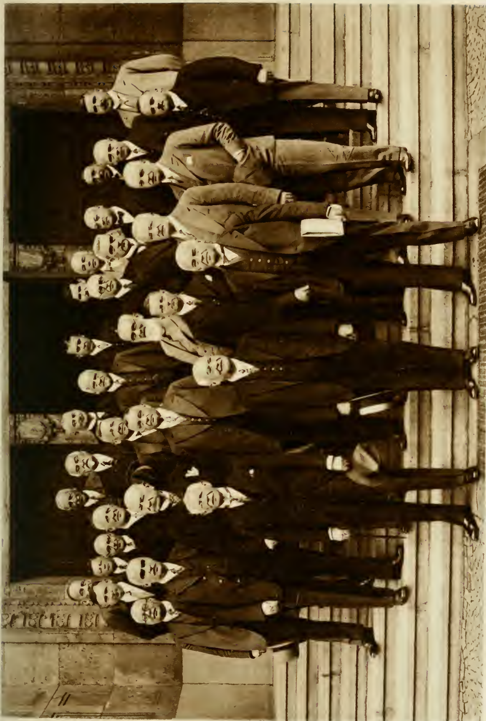
Sitzung des Präsidiums des Reichsverbandes der Deutschen Industrie in Leverkusen am 19. September 1929.